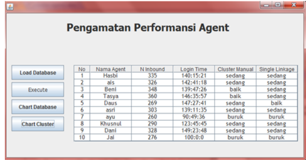
Gambar 4. Performansi Agent

Dari Gambar 4 terlihat bahwa selain terdapat perbedaan jumlah anggota cluster , juga terjadi perbedaan pada anggota di masing-masing cluster.