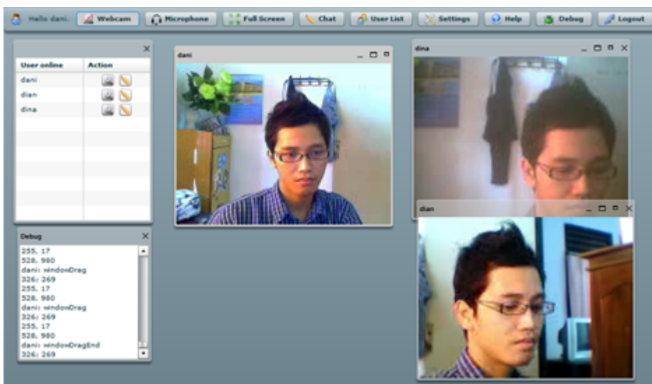
Tampilan GUI dari sistem Web Conferencing