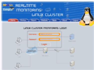
Gambar 2 Desain Interface awal web Monitoring

Desain antar muka pada sistem aplikasi realtime monitoring antara lain mengenai menu home, monitor, report, dan analisa.