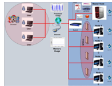
Gambar 1. Blok Diagram Perancangan Sistem

Cluster dibangun pada 1 master node dan 4 slave node dengan menggunakan OpenMPI yang masing-masing node menggunakan system operasi Linux Debian Lenny.