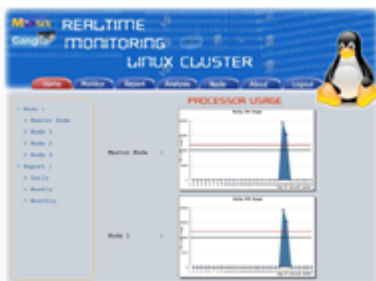
Gambar 3 Desain Interface menu Monitor Processor Usage pada web Monitoring

Pada desain awal web monitoring user akan langsung disuguhkan menu login dimana harus dimasukkan username dan password. Guna dari menu login ini digunakan untuk memfilter user yang diperbolehkan untuk memonitor cluster tersebut.