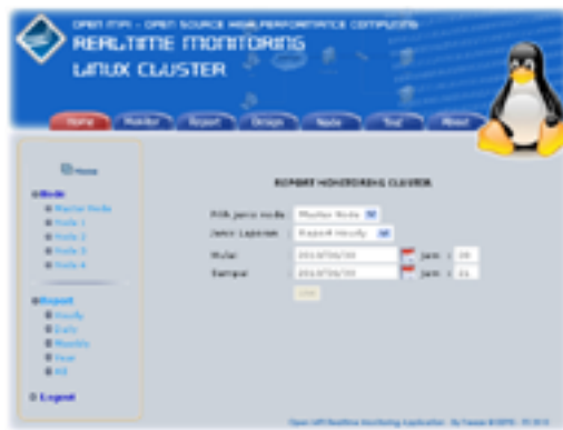
Gambar 5. Menu report cluster dalam web monitoring