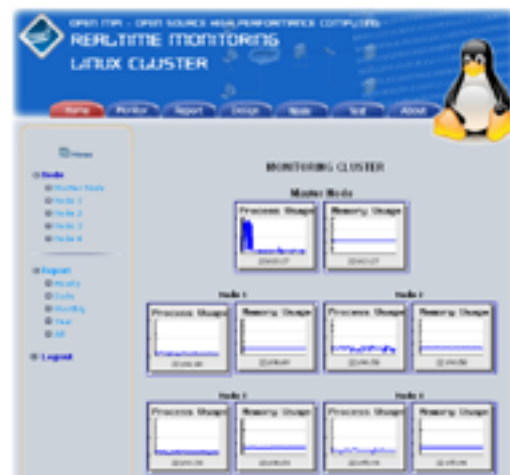
Gambar 2. monitoring cluster